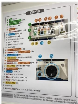
作業工程を文章と写真で「見える化」

大東コーポレートサービスでは働きやすい環境づくりのために、さまざまな工夫がされています。たとえば受注や納期、業務の進捗などのスケジュールをホワイトボードに記入したり、作業工程を写真と文章でわかりやすくしたりと、「見える化」していることです。また、社内のルールや掲示物、お知らせなども「見える化」しています。その他には障がいのある人と健常者とがコミュニケーションしやすくするためのツール(手話での表現統一や障がいの理解のための冊子)の作成などを行っています。