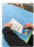
大きな印刷機械を使う一方、細かな部分は手作業で作成