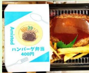
人気のハンバーグ弁当

就労継続支援A型事業所アミスタ Amistad ではお弁当販売を、自立訓練(生活訓練)事業所パツソ Passo (利用期間は2年)では、日常生活に必要なスキルを身に付けるための練習を、ソーシャル相談支援事業所では、一緒に福祉サービスなどの計画を立て、今後の生活を送るお手伝いを行っています。共通していることは、自身のペースで就労訓練やお仕事ができる、支え合いながら生きていく、一緒に生活を組み立てる環境作りをして行くことを目標にしています。