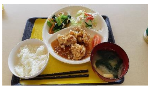
日替りランチ（油淋鶏）