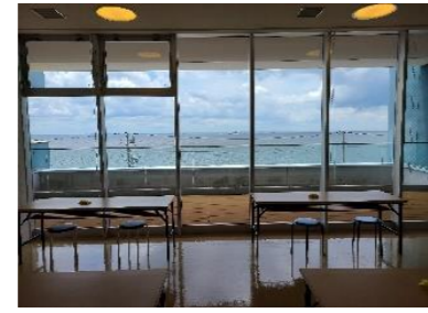
3階食堂から東京湾が一望できます