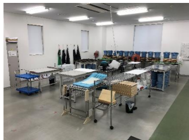
株式会社リクルートスタッフィングクラフツ