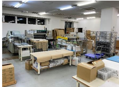
大東コーポレートサービス株式会社