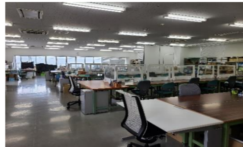
NPO法人タオ(福祉的就労施設)