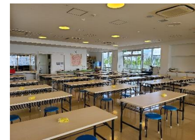
食堂（キッチンタオ）