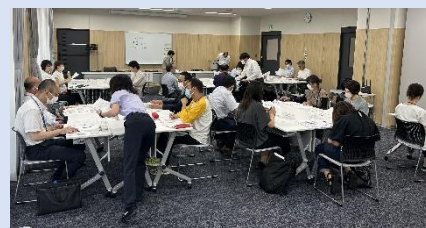
さまざまな意見ができました